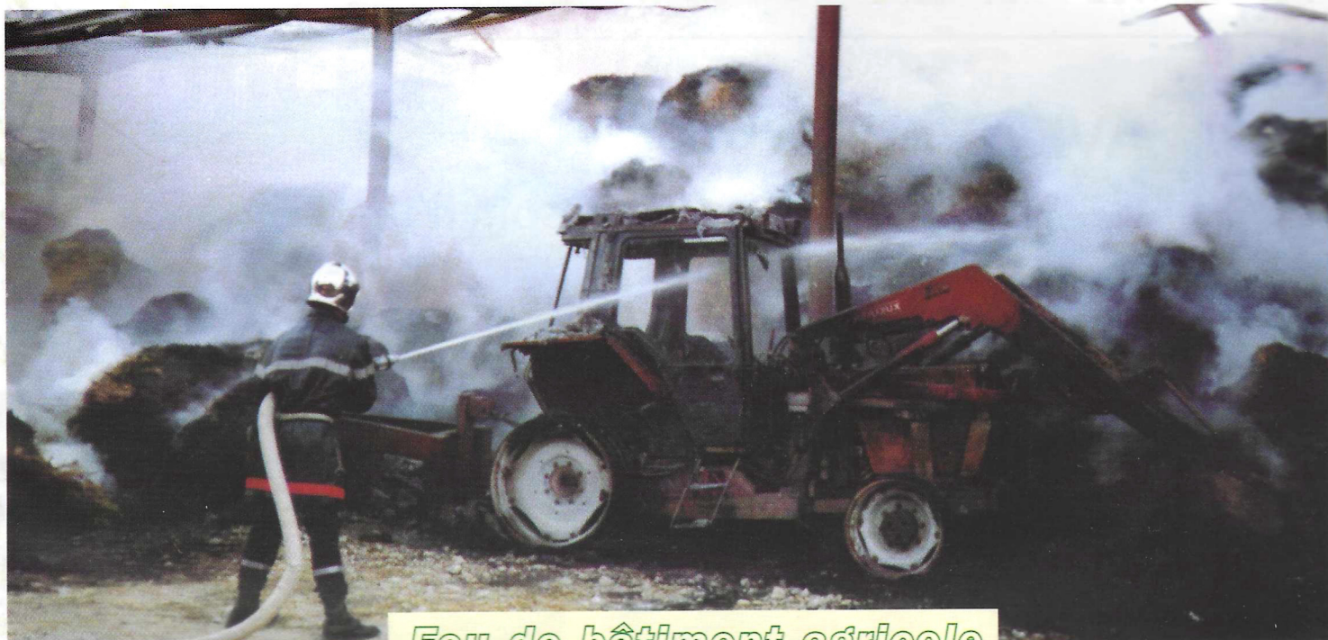
Feu de bâtiment agricole