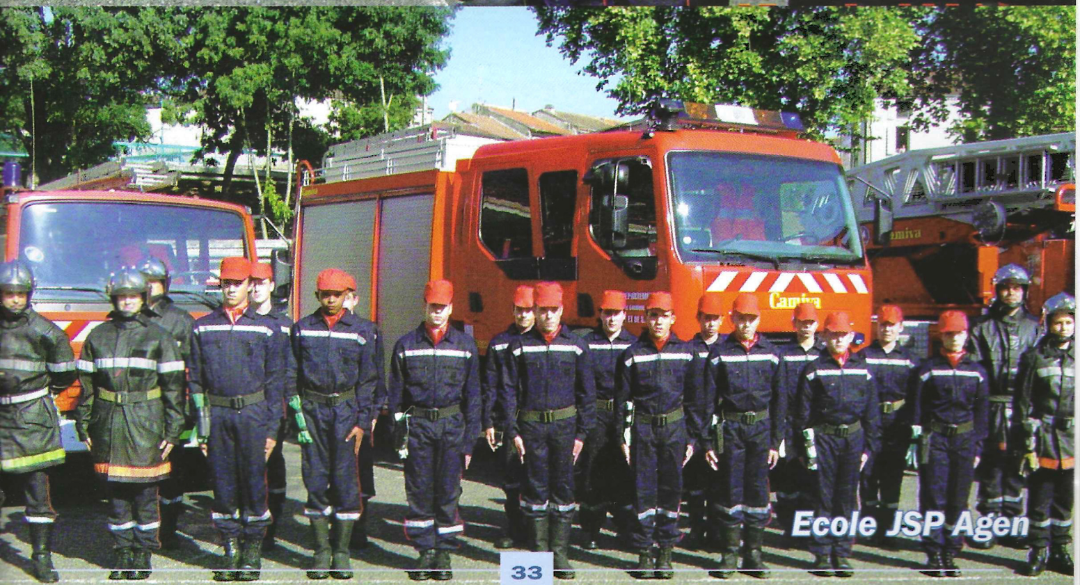
Ecole JSP Agen