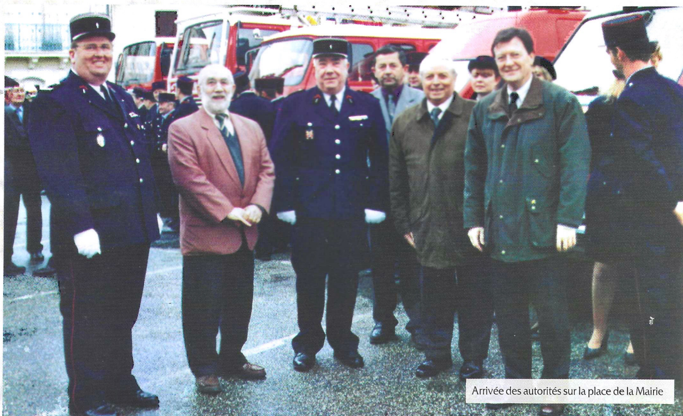
Arrivée des autorités sur la place de la Mairie

- et un tableau de Saint Barbe peint sur toile par l'artiste Marie Andrée Cazalis pour les Sapeurs-Pompiers de Dessenheim.